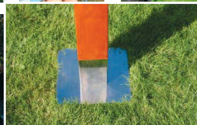
Platine basse inox 240 x 240 mm avec 4 perçages recevant le poteau 90 x 90 mm