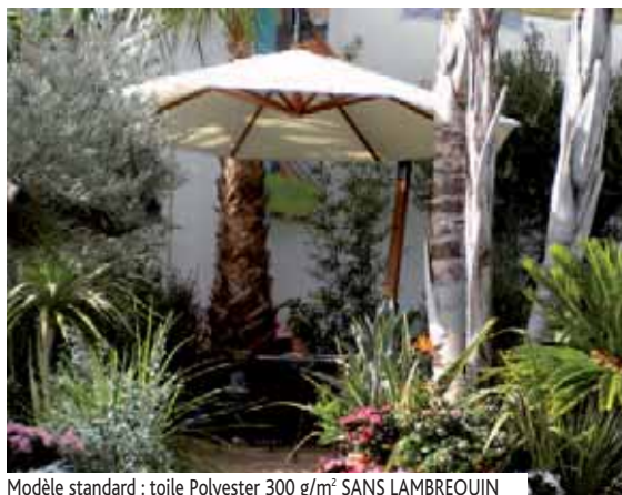
Modèle standard : toile Polyester 300 g/m 2 SANS LAMBREQUIN