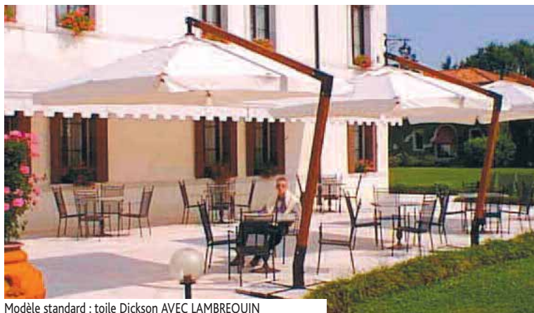
Modèle standard : toile Dickson AVEC LAMBREQUIN